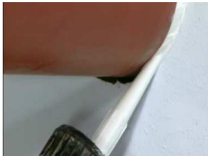
Si nécessaire, réaliser un joint à l'aide de mastic coupe-feu

En voile : Fixer un manchon de chaque côté, en applique ou encastré, mettre un manchon coté feu si le sens du feu peut être défini (après avis de la commission de sécurité ou du bureau de contrôle).