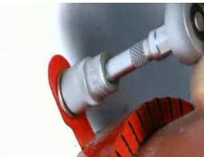
Fixer le manchon à l'aide de chevilles et vis en acier