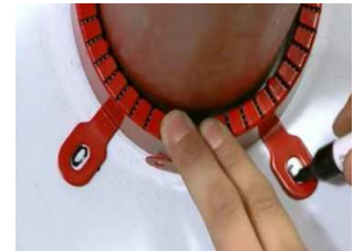
Repérer les fixations